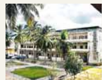
S-21 var först gymnasium och sedan ett fängelse där vistelsen bara kunde sluta på ett sätt: döden på The Killing Fields. Nu är byggnaden museum.

Phnom Penhs 2,5 miljoner människor tvångsflyttades till landsbygden, där de utsattes för hårt fysiskt arbete och svält.