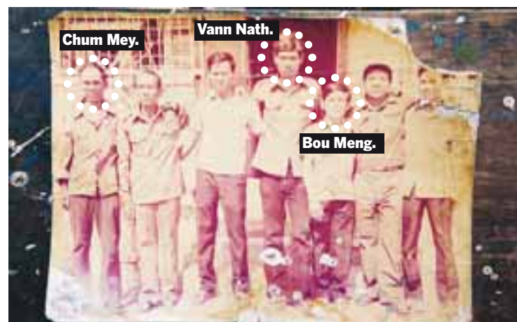
En bild från 1979 på de befriade fångarna i fängelset S-21. Tre av dem (inringade på bilden) lever fortfarande och ska vittna i FN-tribunalen om Röda Khmerernas folk mord i Kambodja.

Runt 14 000 människor passerade S-21, "där den som kommit in aldrig släpps ut igen" som folk sa till varandra.