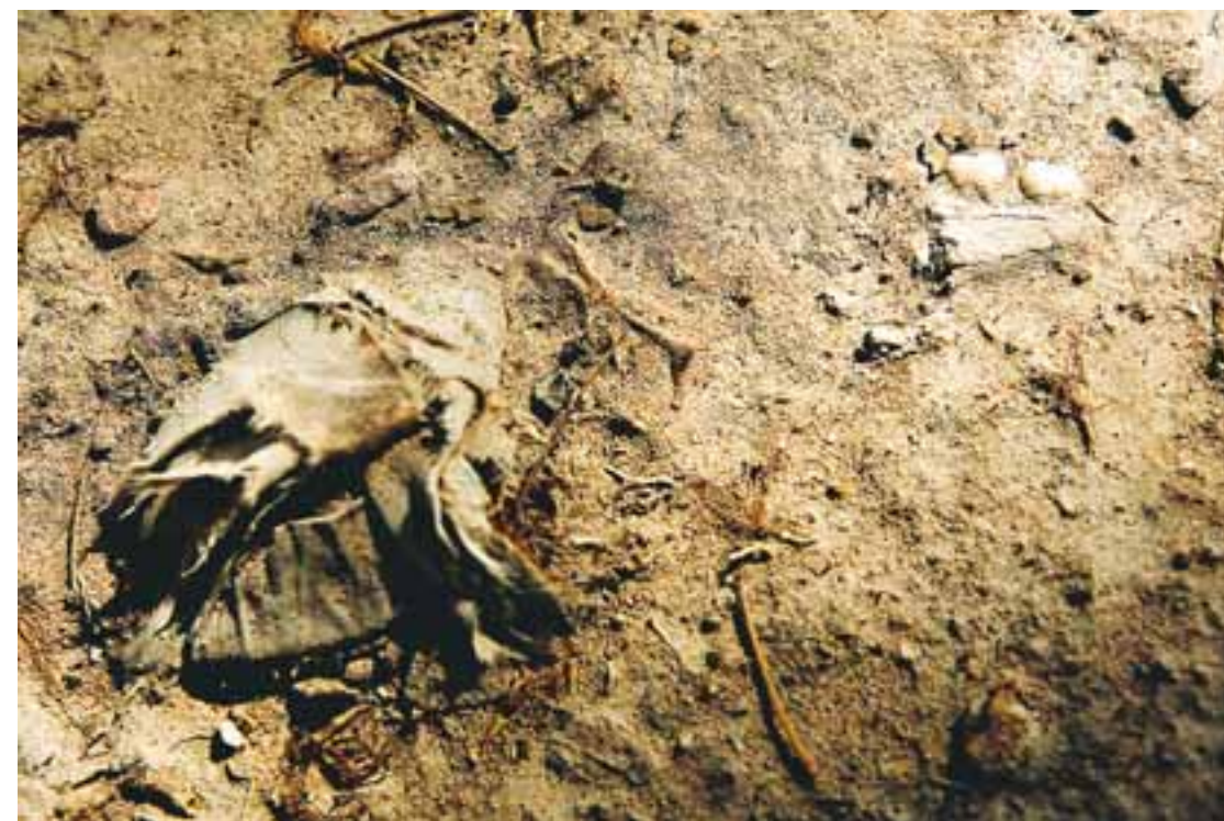
Ur marken på The Killing Fields, Röda khmerernas avrättningsplats utanför huvudstaden Phnom Penh, tränger historien upp: en bit tyg, benbitar ...