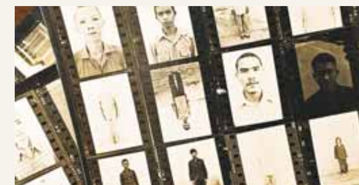
Vakterna i S-21 dokumenterade vad de gjorde, så trots att bara sju fångar lär ha lämnat tortryfängelset i livet, finns mycket kunskap om de tusentals människor som plågades till döds där.