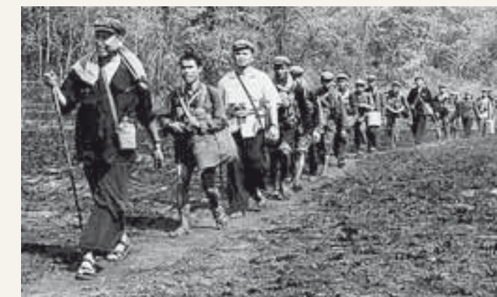
Den här bilden av Pol Pot i spetsen för en kolonn khmerer togs av en japansk nyhetsbyrå 1979. Senare samma år invaderade Vietnam landet och störtade hans skräckregim. Pol Pot flydde till djungeln.