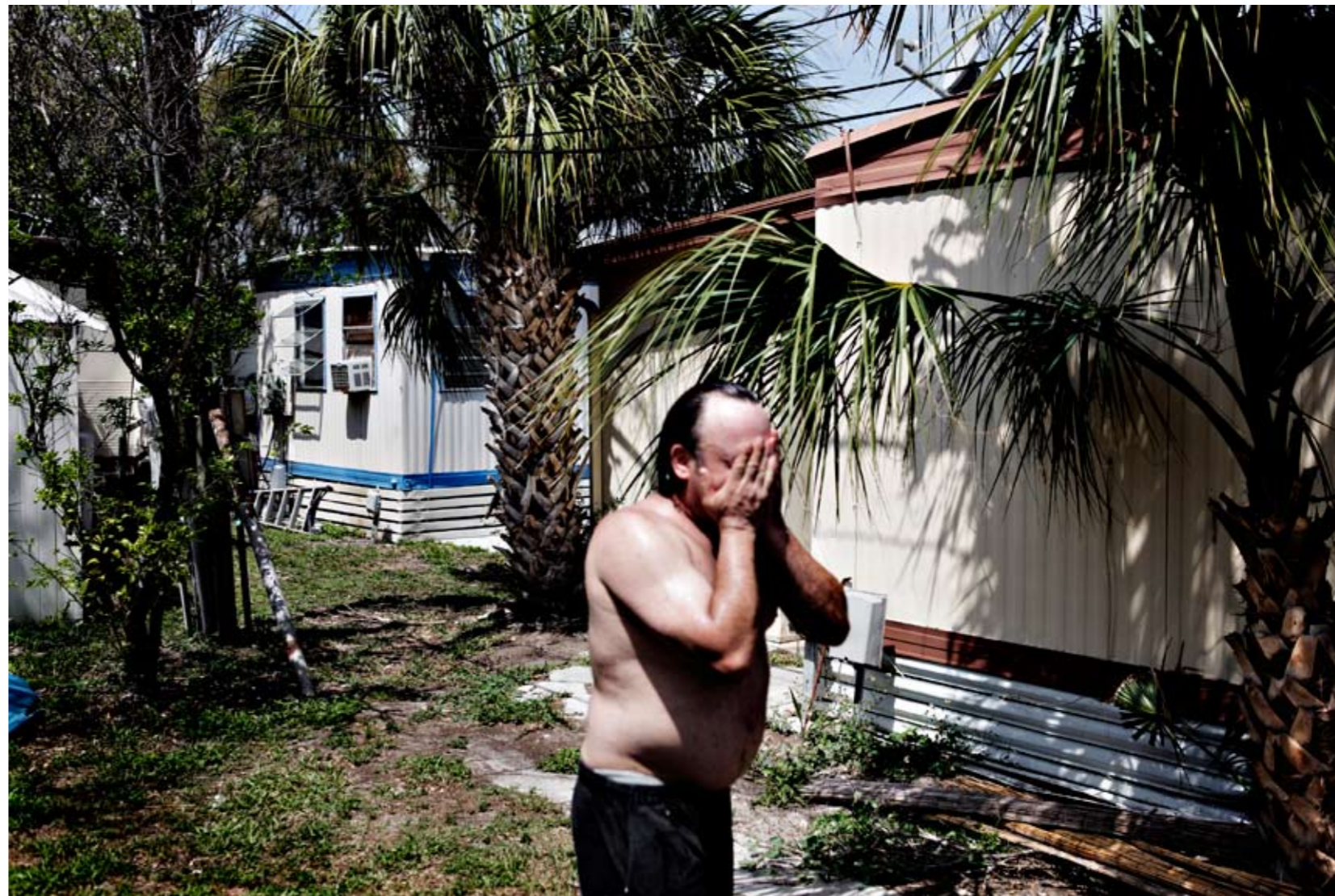
Utsøtt Forbryterne selv kaller trailerparken en moderne spedalsk-hetskoloni.

«Vi er den moderne tids spedalskhetskoloni.» Florida Justice Transitions heter den privateide trailerparken hvor 100 pedofile har forskanset seg. Parken ble startet av en mor til en