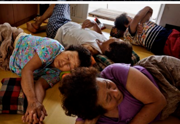
Et utet, quipit wisi tie molortie faccum ing euguerc ipsustrud diametum do eugait ut