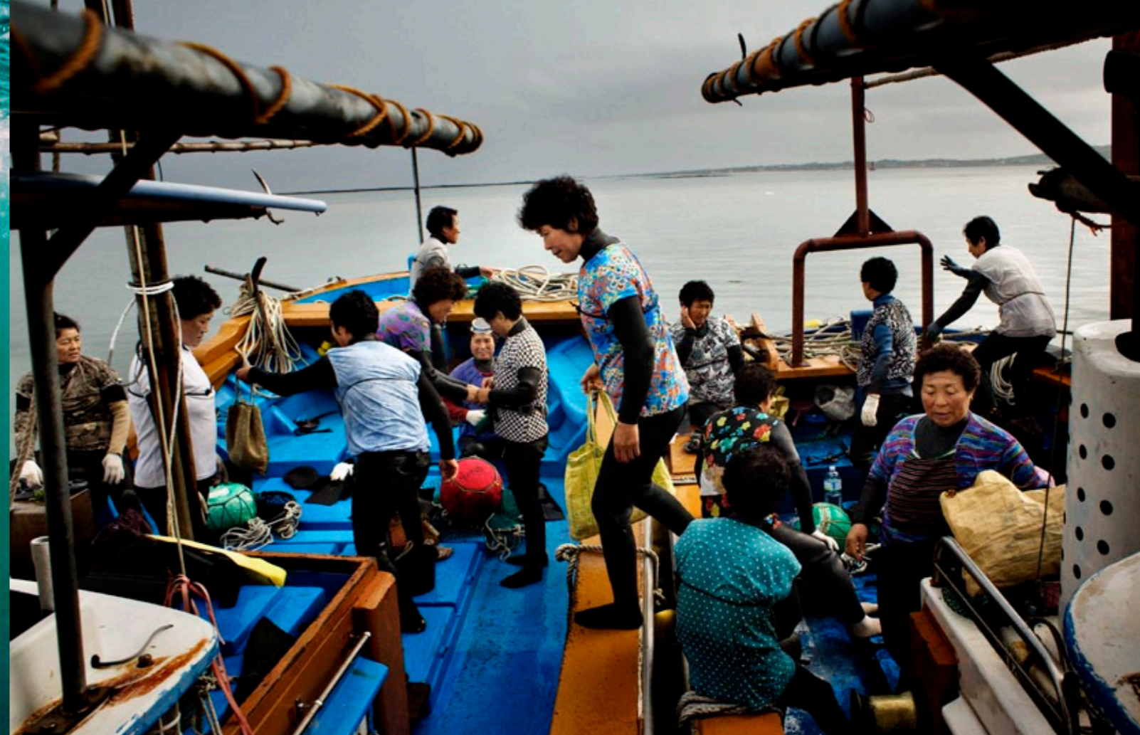
Et utet, quipit wisi tie molortie faccum ing euguerc ipsustrud diametum do eugait ut

I hænderne knuger hun et langt spyd og en lille dolk.