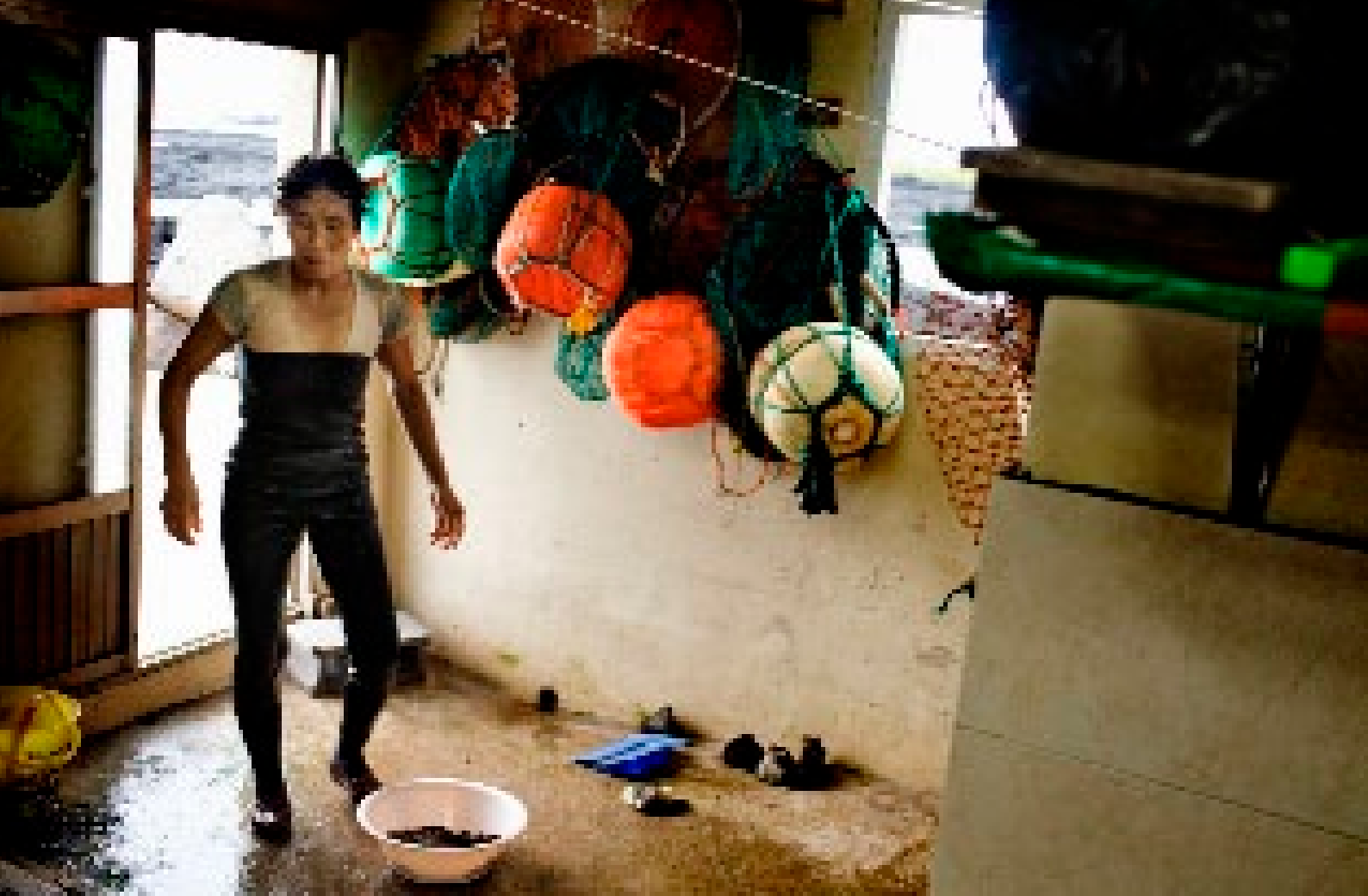
Et utet, quipit wisi tie molortie faccum ing euguerc ipsustrud diametum do eugait ut

skaldyr i Kina eller fra farme, fordi de er langt billigere end dem, haenyeoerne håndplukker i havet.